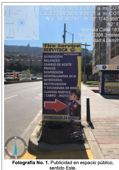
Fotografía No. 1. Publicidad en espacio público, sentido Este.