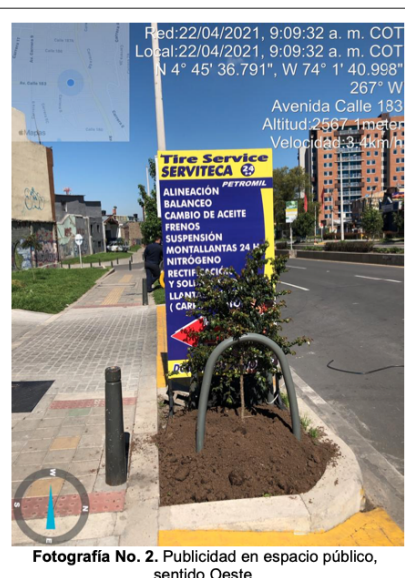
Fotografía No. 2. Publicidad en espacio público, sentido Oeste.